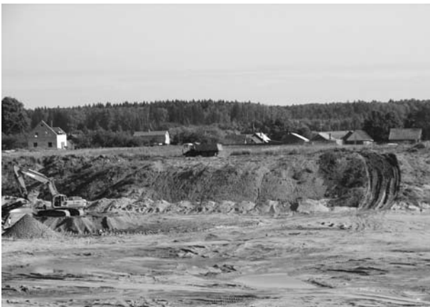
Завтра дома в карьер упадут