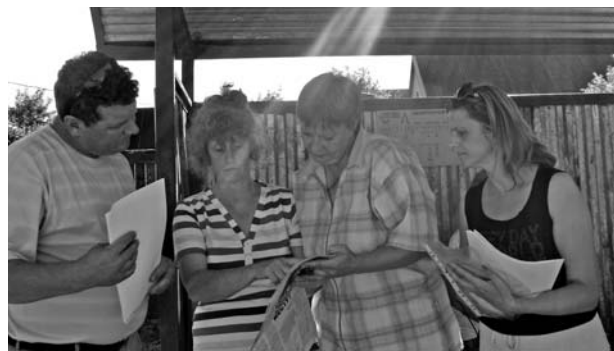
Редакция газеты на месте событий