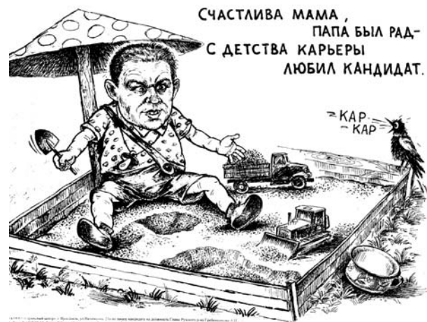
Карьерный мальчик районного масштаба

Дорога наша единственная и не рассчитана на прогон гружёных машин, а тем более хлипкий мостик через речку Исьма у с. Богородское. От этой дороги зависит вся наша жизнь, по ней ходит единственный рейсовый автобус. Жители на всеобщем сходе единогласно выразили протест